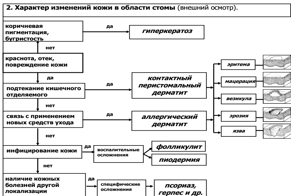
Рис.5. Определение характера изменений кожи в области стомы.

При внешнем осмотре оценивают окраску кожных покровов, наличие и степень их повреждения. Устанавливают связь между появлением изменений в перистомальной области и воздействием различных факторов (протекание кишечного отделяемого под пластину, применение новых средств ухода за стомой, инфицирование кожи или волосяных фолликулов, наличие кожных болезней другой локализации). Для дифференциальной диагностики могут быть использованы патоморфологические и микробиологические исследования.