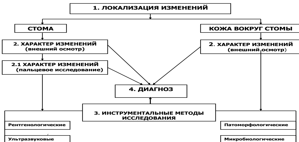
Рис.2. Алгоритм диагностики осложнений кишечных стом.

После определения локализации осложнений (стома или кожа вокруг стомы) визуально устанавливают характер изменений в области стомы. Если изменения касаются самой, выведенной на переднюю брюшную стенку, кишки, оценивают их характер при внешнем осмотре (рис.3).