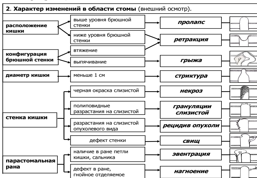
Рис.3 Определение характера изменений в области стомы с помощью внешнего осмотра.

После определения локализации осложнений (стома или кожа вокруг стомы) визуально устанавливают характер изменений в области стомы. Если изменения касаются самой, выведенной на переднюю брюшную стенку, кишки, оценивают их характер при внешнем осмотре (рис.3).