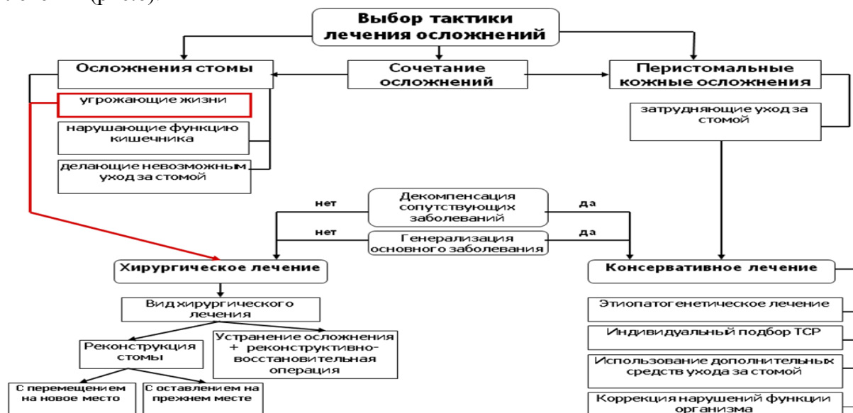
Рис. 6. Алгоритм выбора метода лечения осложнений кишечной стомы.

После выявления осложнений, связанных с наличием стомы, в зависимости от их типа (осложнения стомы, перистомальные кожные осложнения или сочетание осложнений) определяют показания к проведению хирургического или консервативного лечения (рис.6).