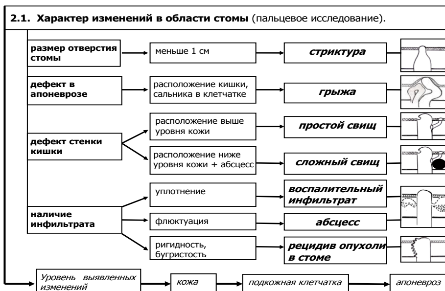
Рис.4. Определение характера изменений в области стомы с помощью пальцевого исследования.

При необходимости уточнения диагноза применяют инструментальные и лабораторные методы диагностики: